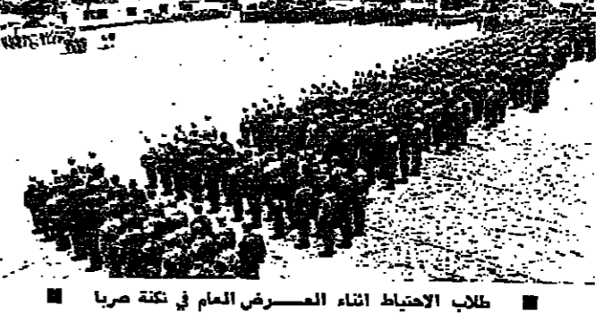
طلاب الاحتياط أثناء العرض العسكري في تكة صريا